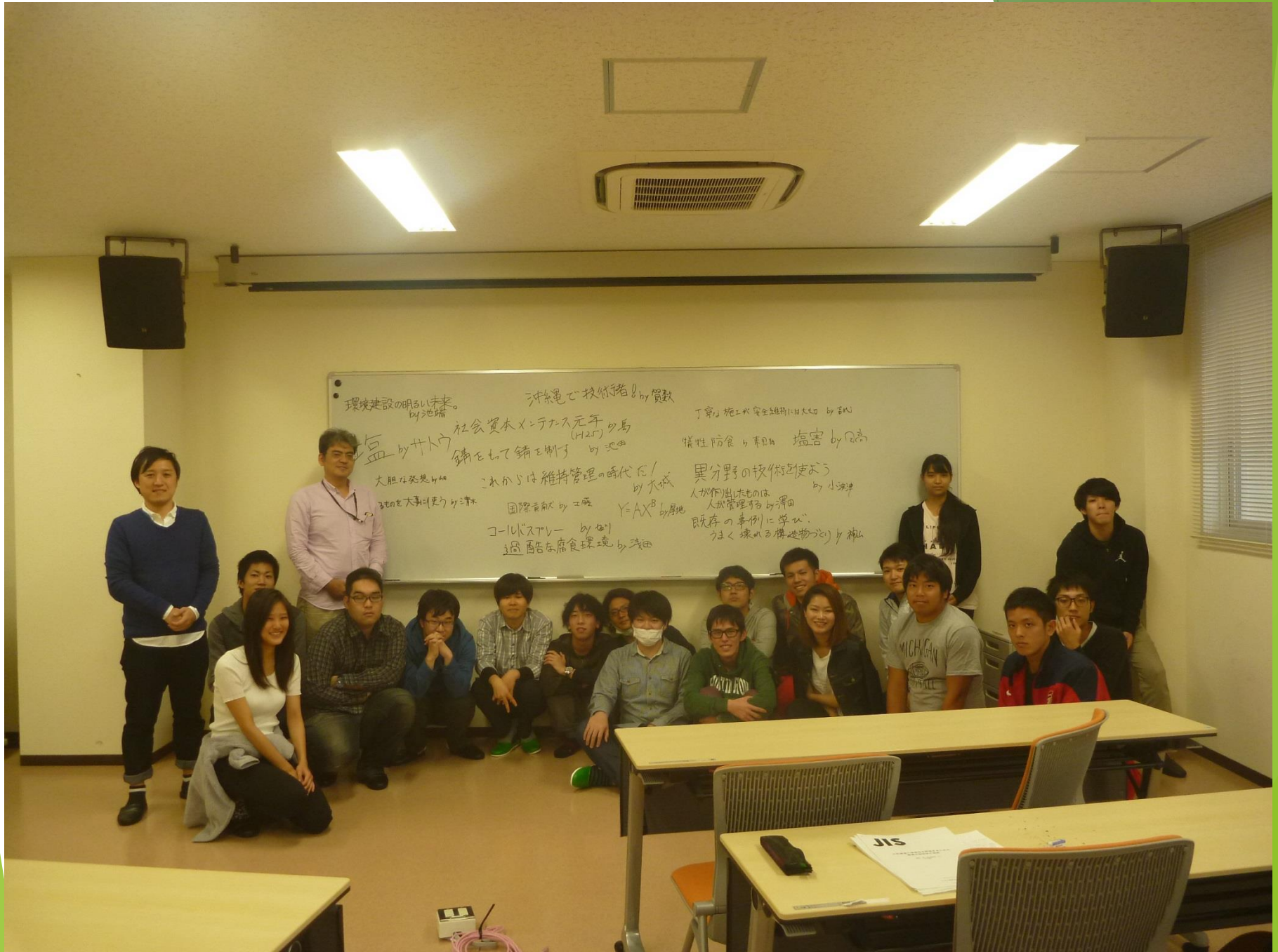
他学部の方も参加し、とても楽しい授業でした。