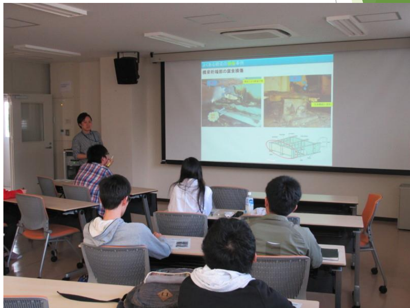
約20名の学生の前で日本の橋梁が抱える問題や、構造研究室がどのような研究をしているかなどを内容に、2日に分けて講義を行いました。