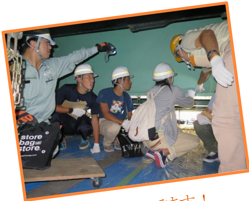
熱心に聞いてます！