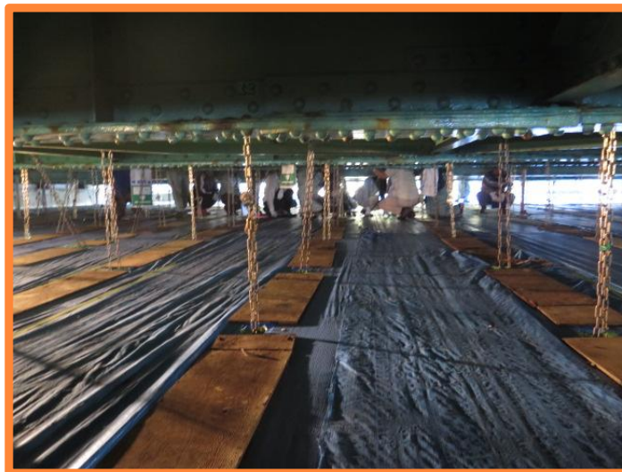
桁下！みんなハイハイして通りました～